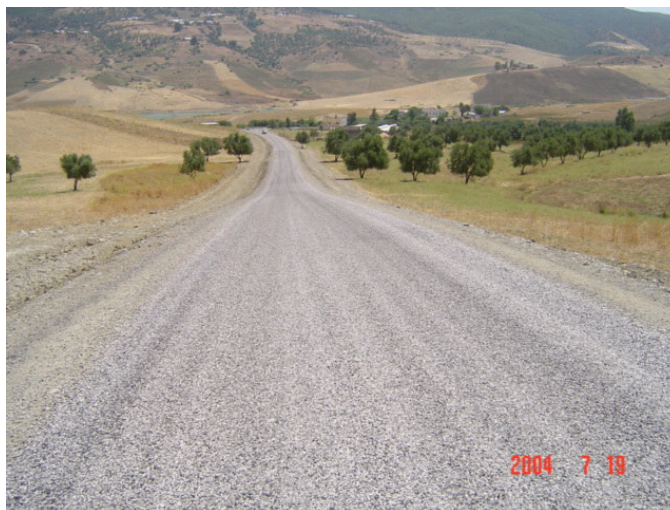
Couche de roulement en enduits superficiels d'une route provinciale à Taounate

Le reprofilage aux enrobés permet traiter les sections dégradées et améliorer l'uni de la chaussée avant l'application de la couche de roulement en enduit superficiel.