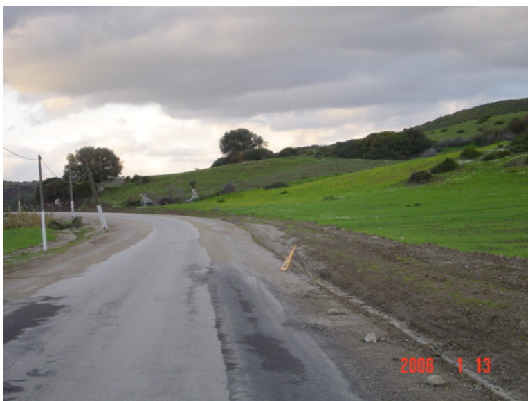
Purges latérales et reconstitution du corps de la chaussée

Avantage d'ordre économique : cette technique permet d'éviter des renforcements de chaussée généralisés et coûteux. Dans plusieurs cas, un simple enduit superficiel, après le traitement des points névralgiques, peut suffire.