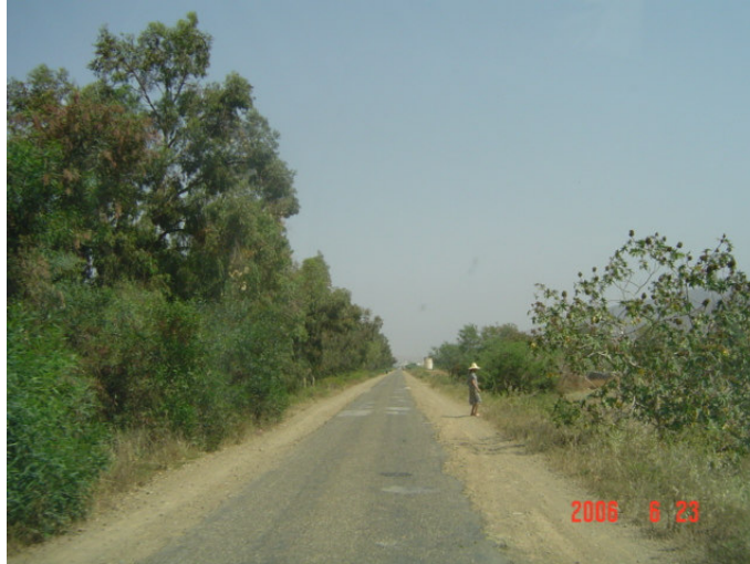
Chaussée épauprée d'une route provinciale à Al Hoceima