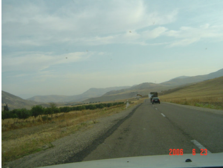
Epaufures traitées en EAF sur la RR505 à Taza