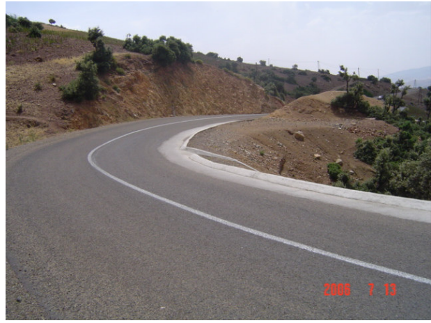
RN2 à Al Hoceima : muret de

protection, accotement bétonné et descente d'eau